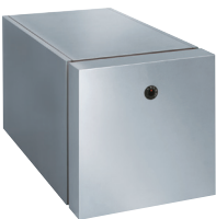
Vitocell-H 300 Compact et empilable