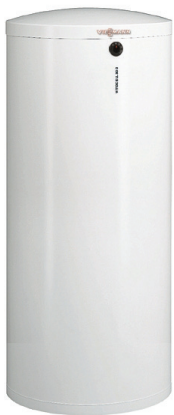
Vitocell 300-W, EVIA Nouveau modèle compact avec couleur agencée aux chaudières murales