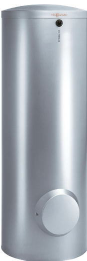
Vitocell-V 300 Pratique, durable, hygiénique